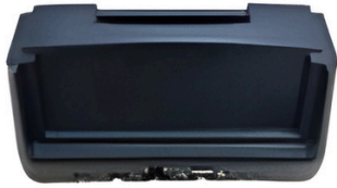
Estación de conexión