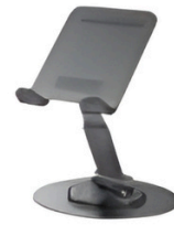
Soporte para escritorio